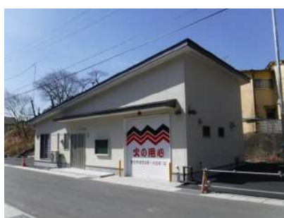
東前地区消防屯所建設工事