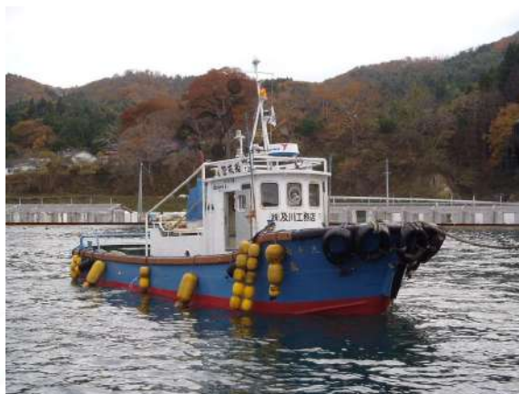
■名称：第37長丸 作業船 ■メーカー名：東洋造船鉄工所 ■L=9.75m B=2.8m H=1.05m ■エンジン：280ps×1基