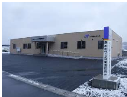
新おおつち漁業協同組合事務所新築工事