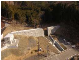
花露辺の沢（1）地区砂防堰堤（右岸本堤工ほか）工事