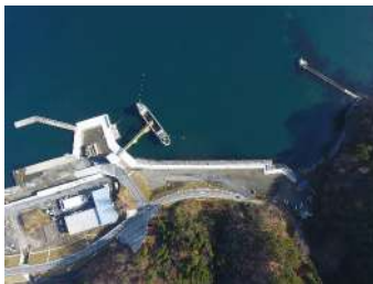
大槌漁港県単災害復旧（護岸その2）ほか工事