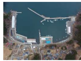
白浜（釜石）漁港海岸災害復旧工事