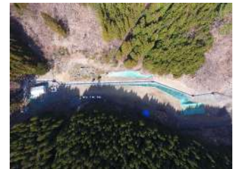
東京大学地震研究所釜石海底地震観測点災害復旧工事