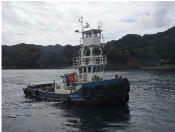
■名称：第8長丸 曳船 ■メーカー名：前川造船 ■L=14.0m B=5.3m H=1.84m ■エンジン：680ps×2基