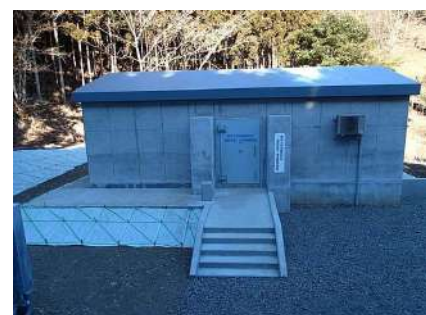
東京大学（釜石）地震研究所観測点陸上局舎新営その他工事