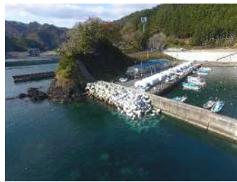
両石漁港漁港施設機能強化（護岸（改良）その2）工事