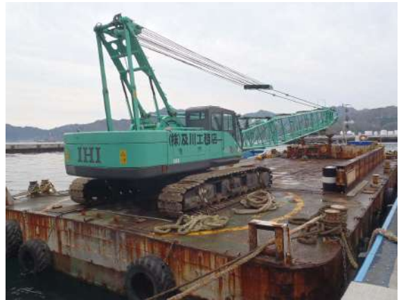
■名称：第18長丸 クレーン付台船 ■メーカー名：IHI建機 ■型式：70 t吊 ■台数：1台