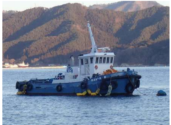
■名称：第55長丸 曳船 ■メーカー名：赤松造船 ■L=11.94m B=5.22m H=2.13m ■エンジン：750ps