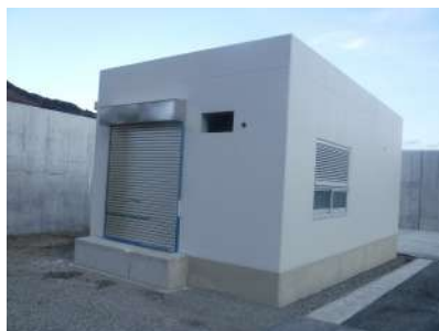
平田漁港海岸災害復旧（電気室）工事