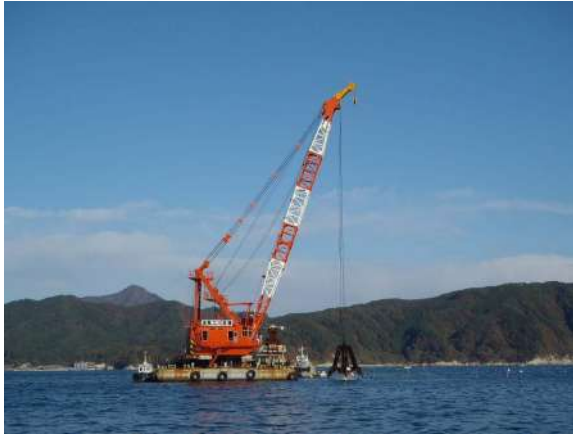
■名称：第1号長丸 非航式起重機船 ■メーカー名：IHI建機 ■型式：全旋回 250 t吊 ■台数：1隻