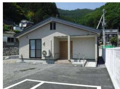
新浜町地区集会所建設工事