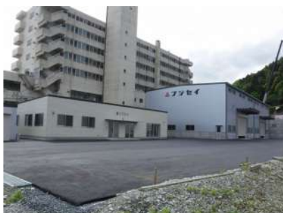
（株）フジセイ事務所・倉庫新築工事