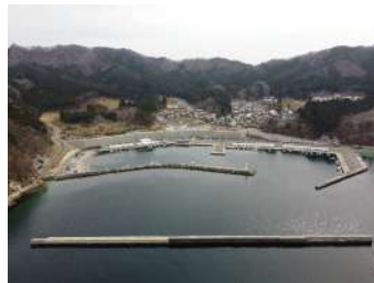
白浜（鶴）漁港漁港施設機能強化（防波堤（改良）ほか）工事