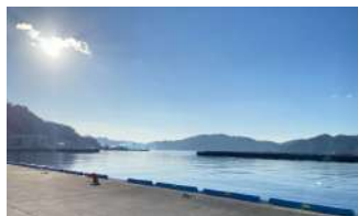
▲会社から徒歩1分の港