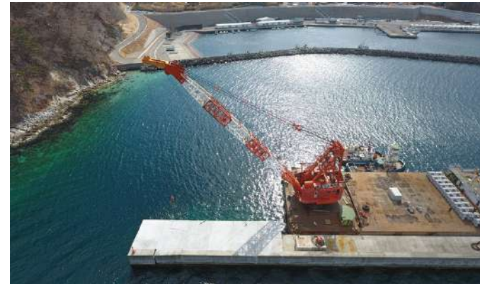
◀ 防波堤施設強化工事

主に漁港・港湾工事、道路災害復旧工事等の土木・建築事業を行っています。特に弊社は「海洋土木工事」を得意とし、釜石をはじめとした地域の経済基盤を造っています。