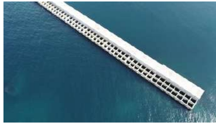
▲ 発電を行う釜石湾防波堤