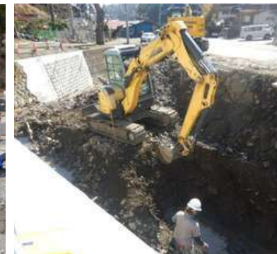
▲ 災害のあった河川の整備