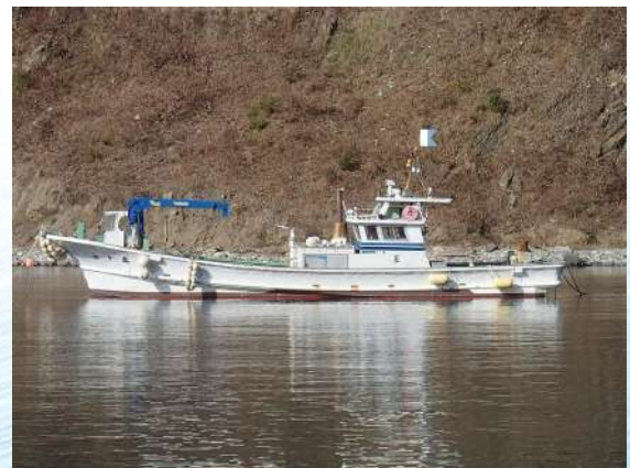
■名称：雄幸丸 作業船 ■メーカー名：大和造船所 ■L=11.65m B=2.8m H=0.8m ■エンジン：360ps