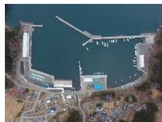
白浜（釜石）漁港海岸災害復旧工事