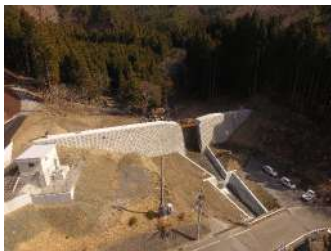
花露辺の沢（1）地区砂防堰堤（右岸本堤工ほか）工事