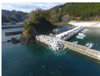
両石漁港漁港施設機能強化（護岸（改良）その2）工事